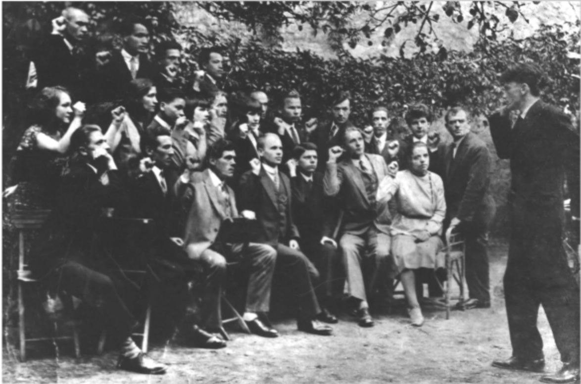
▲ Група членів ОУН, 1930-ті рр.

Організація Українських Націоналістів. Полковник Євген Коновалець, котрий очолив ОУН, став своєрідним містком між двома поколіннями борців. Його вагомий авторитет та непересічний розум згладжували неминучі непорозуміння між молодшими та старшими членами.