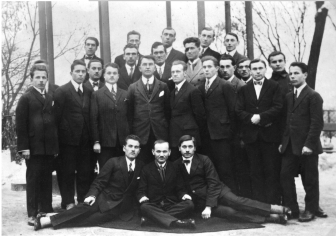
▲ Група членів УВО. Долинщина, Івано-Франківська область, 1920-ті рр.

різноманітних партій. До того ж саме в цей час в організації стали ширитися радянофільські настрої — частина з її членів, дотримуючись принципу «ворог мого ворога — мій товариш», вирішила покластися в антипольській боротьбі на допомогу СРСР. Засадничі розходження у виборі союзників призвели до конфлікту, який, утім, невдовзі було залагоджено. Прихильники співпраці з Радянським Союзом відійшли від УВО, створивши Західноукраїнську Народну Революційну Організацію.