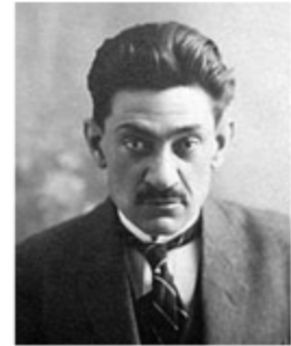
▲ Дмитро Донцов — один з ідеологів українського націоналізму.

► Перше видання праці Д. Донцова «Націоналізм» (1926).