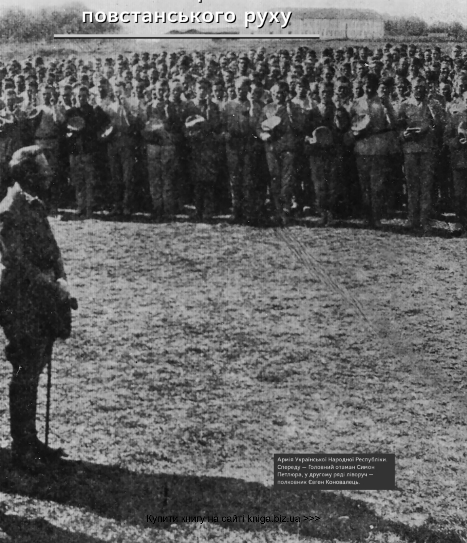
Армія Української Народної Республіки. Спереду — Головний отаман Симон Петлюра, у другому ряді ліворуч — полковник Євген Кошовий.