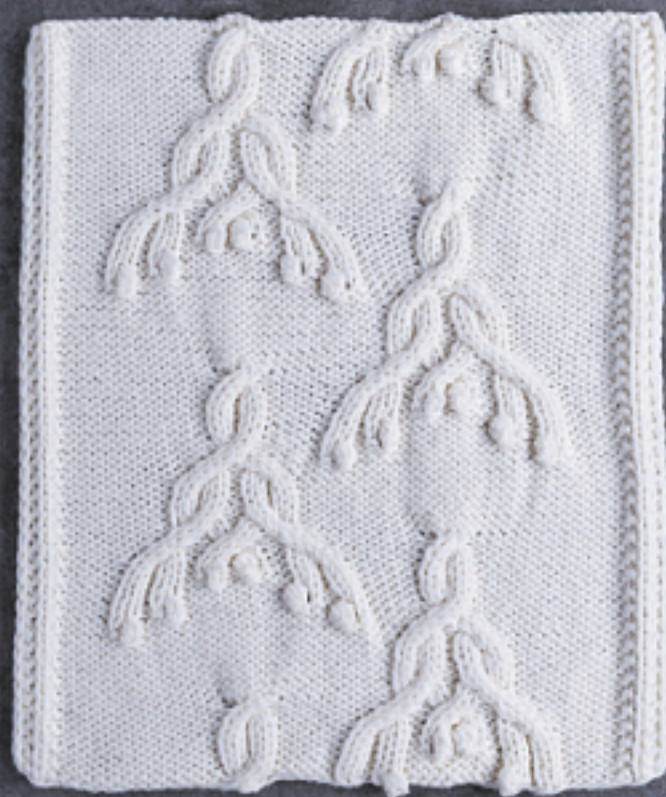
В'юнка квітка (# 114)

великі візерунки з кіс замість комбінації з дрібніших. Я детально розповім про це у першому розділі й окремо згадуватиму про заміни кіс в інструкціях до проектів.