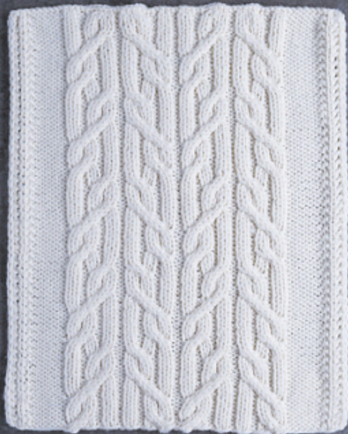
Похилений паросток (# 111)