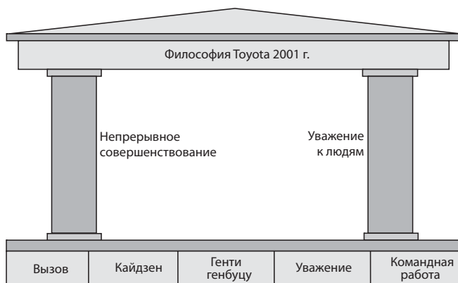
Рис. 1.2. Философия Toyota 2001 г.

Под каждым из пяти фундаментальных принципов располагаются детализирующие концепции, например под принципом «кайдзен» имеется три подкатегории: настроенность на непрерывное улучшение и инноваци-