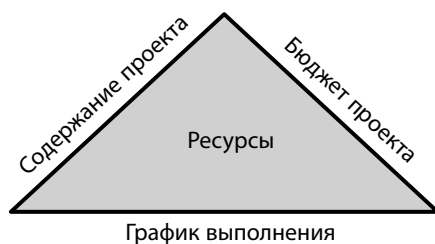
Рис. 1.3. Соответствие цели возможно при соблюдении трех обязательных условий

проекта есть цель. Цель достигается при соблюдении трех граничных условий, как показано на рис. 1.3. Содержание проекта — проектное задание — это описание того, чего как минимум мы хотим достичь по завершении проекта, каков желаемый результат. Бюджет проекта и график выполнения — максимум того, что мы готовы на это потратить. В центре — ресурсы, они связаны с каждым из трех необходимых условий и влияют на них и на успешность реализации проекта.