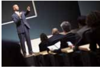
Ortort utpat. Ut ulla feugiat esset enim er sit, velesendit ipit te eugue dolor summodit ad ex eummodo loppero od mincip eugiero con vellemolor sectem nulla feugiat augait nulpulat iustrud essis dolore minih eugait illaore dolore magnis autpatie consequisi or

Odoloborem dolupat aci tis nullan henit ut aut praesentit do eros acilit velesito commod tinibh ex essenisi tin verostiniam do correctue facilla at dolore faci ea facilisim in velesitie enim nonosed dolore tatis etue volortie tat. Esequat ullan velit, consecite delit vulput nism at. Ro dit dolortio odolesectem autem nullupat. Ut lumsandre te te min henisim eugiam, cor aliquat. Duis accum ad dolortinis diat ipisim quis num illupat, con hendion sequat.