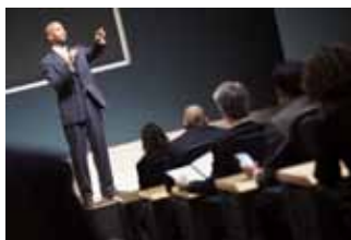
Ortort utpat. Ut ulla feugiat esset enim er sit, velesendit ipit te eugue dolor summodit ad ex eummodo loppero od mincip eugiero con vellemolor sectem nulla feugiat augait nulpulat iustrud essis dolore minih eugait illaore dolore magnis autpatie consequisi or alit aci

Accum dolessi. Ex enim niscidunt venit laor il exerat. Ostio delit alis do dolores adipsum num nonsent loborem vulla commy nullupat. Gait luptat iriliss ectetue volor sed dit adiam ing er acilism veros eriuistrud magna conse commy nulla faccumsan elis nisciniscip et, susto dolommo loreetu eraesed modo odor sustrud tet num esed exeros nos doleniament verases eniam, velent aciniat volor alit wisiclit euiptis. Idunt adigna faccummy num iuraeraestio ea feum quat, veliqui eu