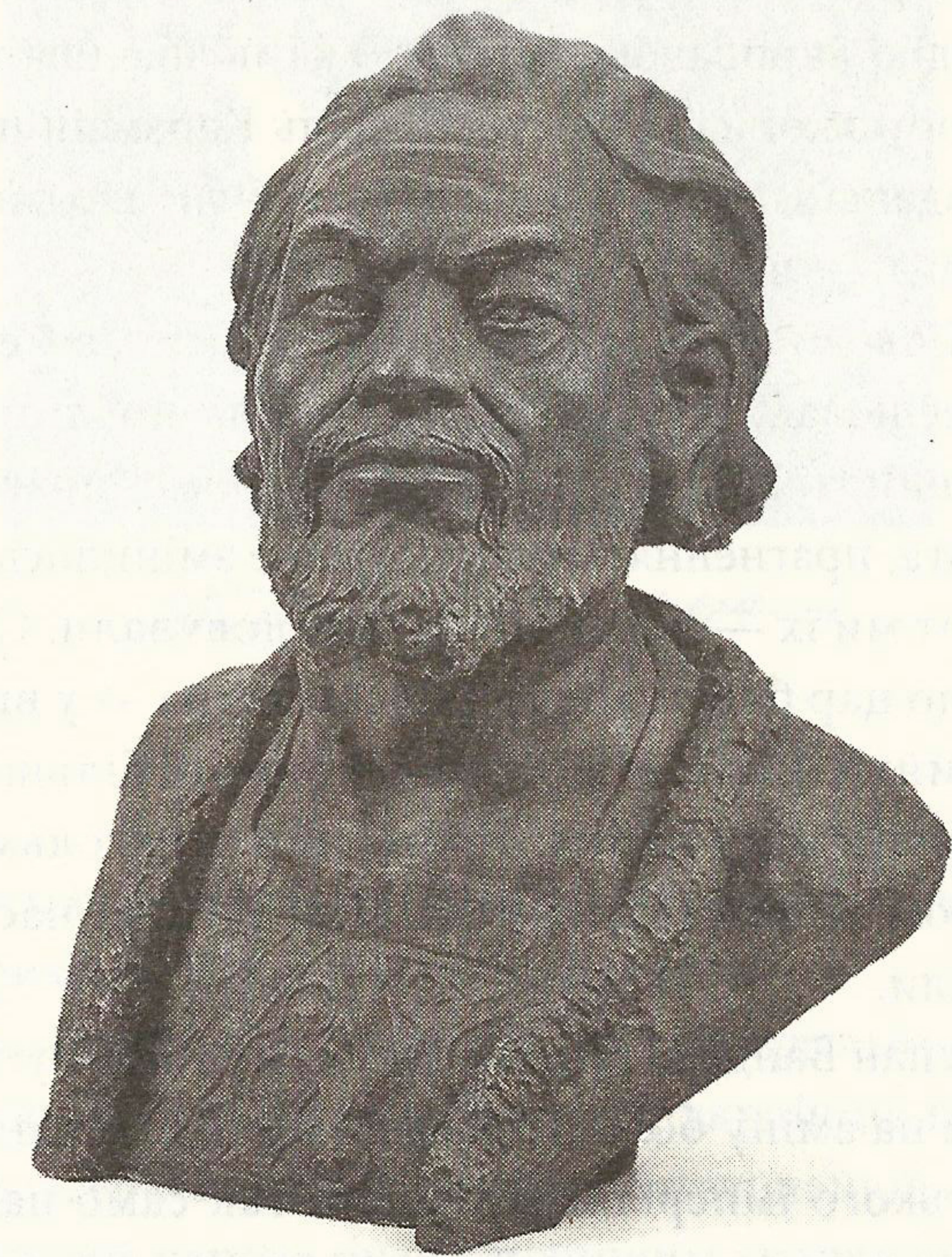
Андрій Боголюбський. Реконструкція за черепом

Так було завжди, просто інтенсивність і методи варіювалися залежно від кровожерності того чи іншого кремлівського ватажка. Але загалом і знищення Січі царем Петром, і заборона козацтва Катериною чи української мови Олександром, і навіть брежневська русифікація — то все щаблі повзкого, невпинного геноциду. Бо без деукраїнізації України, про яку