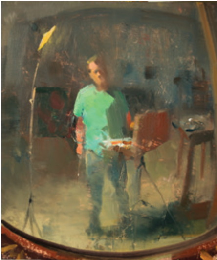
Дуэйн Кайзер. Автопортрет в выпуклом зеркале . 2013. Масло, бумага. 15 × 20 см. Дуэйна считают родоначальником ежедневной живописи.