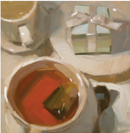
Сюрприз. 2012. Масло, деревянная панель. 15 × 15 см.

Угроза. 2011. Масло, деревянная панель. 15 × 15 см.