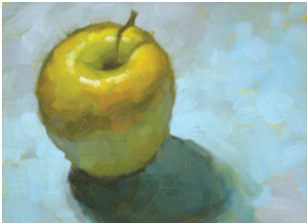
Яблоко . 2006. Масло, бумага. 15 × 20 см. Моя первая «ежедневная» картина.