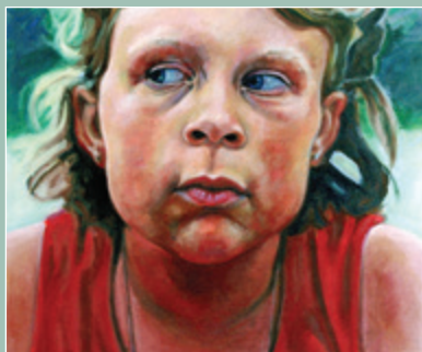
Ханна. 1999. Масло, холст.