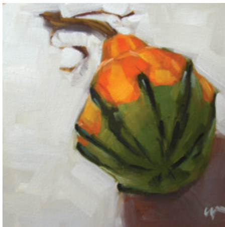
Вот так тыква! 2007. Масло, деревянная панель. 15 × 15 см.

К этому времени многие художники присоединились к движению «ежедневной живописи», создавая блоги на бесплатном ресурсе Blogger (blogger.com), где все желающие могут обсуждать картины. На сегодняшний день сформировалось (и продолжает расти) огромное сообщество «ежедневных» художников. В то время как большинство художников считает свою работу