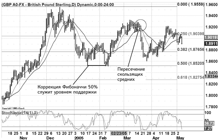
РИС. 1.1. Курс GBP/USD

Из графика курса GBP/USD (рис. 1.1) видно, что коррекции, скользящие средние и стохастический осциллятор довольно точно предсказали поведение рынка в будущем. Например, коррекция 50% служит уровнем поддержки для пары GBP/USD в январе и феврале 2005 г. Помимо этого, пересечение простых скользящих средних за 10 и 20 дней точно предсказало сброс GBP/USD 21 марта 2005 г. Наиболее эффективно технический анализ могут использовать трейдеры фондового рынка, которые в сделках с ценными бумагами также опираются на графики и индикаторы. На Forex можно применять те же стратегии.