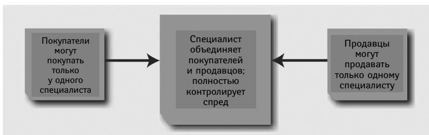
РИС. 1.2. Структура централизованного рынка

Поскольку Forex — это рынок без посредников, торговля на нем осуществляется вне биржи, маркетмейкеры в силу конкуренции не могут применять монополистические ценовые стратегии. Если одна фирма попытается существенно изменить цены, то трейдеры всегда смогут выбрать другую. Кроме того, инвесторы внимательно отслеживают спреды, чтобы маркетмейкер не мог изменять стоимость сделки. Что касается фондовых бирж, то многие из них работают по противоположному принципу. Так, если акции компании зарегистрированы на Нью-Йоркской фондовой бирже (New York Stock Exchange, NYSE), то их можно продавать или покупать только на NYSE. Централизованные рынки работают через людей или фирмы, которых принято называть специалистами , в то время как термин маркетмейкеры используют, когда говорят о децентрализованных рынках (рис. 1.2 и 1.3).