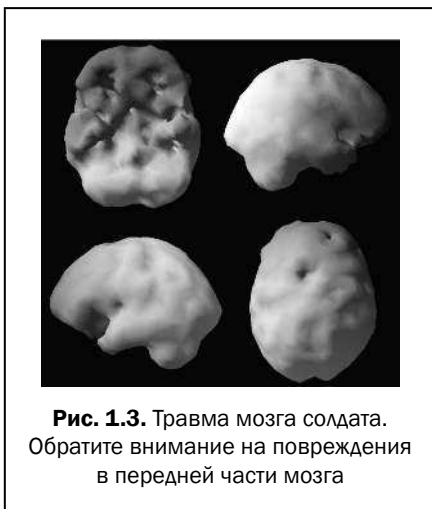
Рис. 1.3. Травма мозга солдата. Обратите внимание на повреждения в передней части мозга

в результате взрыва. Этот солдат был демобилизован из армии в первый же год после инцидента, поскольку постоянно ввязывался в драки с сослуживцами. Причем это началось после того, как он получил травму. Влияет ли повреждение мозга на способность человека нормально общаться с другими людьми? Несомненно! Стоит повредить мозг, и повреждается разум, а вместе с ним практически все остальное в жизни человека.