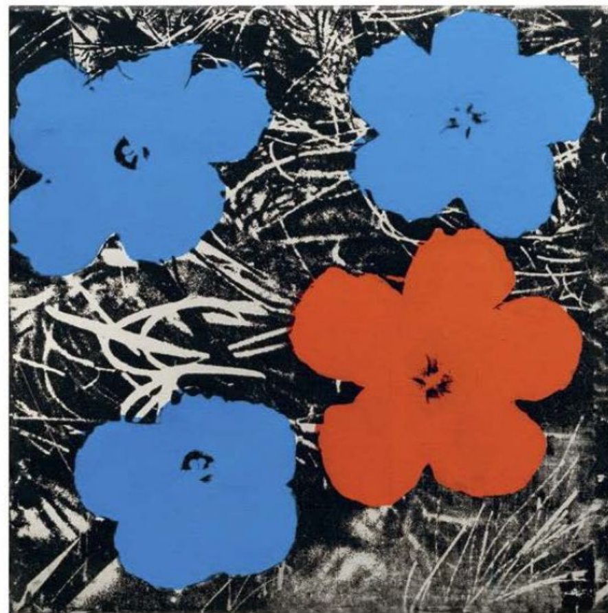
Стюртевант Кеїтні Ворєїт 1964–1965