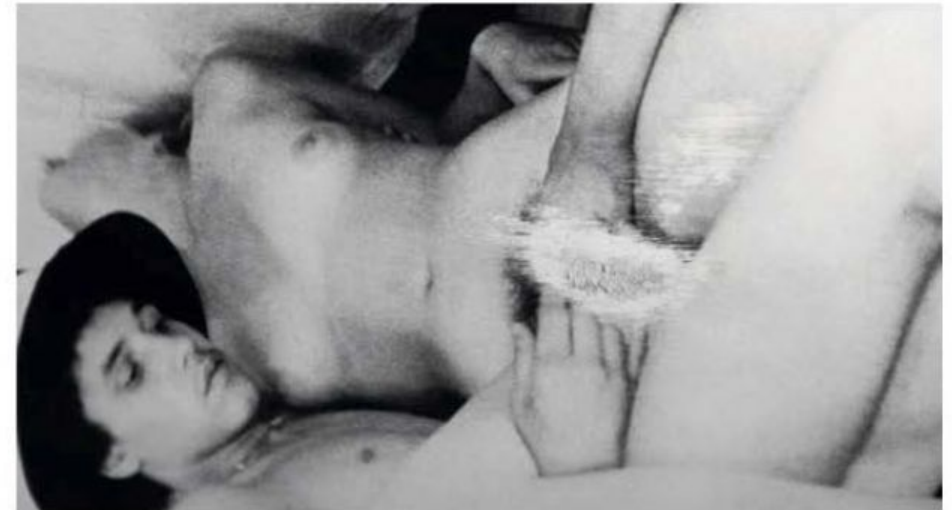
Джеймс Річардс Путянок трагедії (кадр із відео) 2013

«Усе так», – подумав я. Але найбільше мене зацікавив наступний абзац. «Три з чотирьох робіт належать до так званого “мистецтва рухомого зображення” (яка бридка назва), але на цьому подібності не закінчуються», – писав журналіст Daily Telegraph .