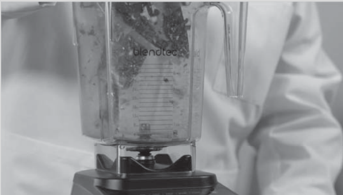
Рис. 2.2. А это перемелется?