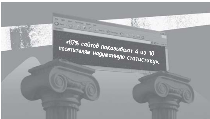
Рис. 2.1. Выведем на чистую воду ненадежную статистику

Видео — самый эффективный способ донести информацию о бренде, однако нас окружает много ненужной (и вполне подозрительной) информации, пытающейся доказать это утверждение. Команда Hurricane сняла короткий ролик, чтобы развенчать ненадежную статистику и показать, как на самом деле работает видеомаркетинг: https://www.youtube.com/watch?v=dNH0fPjVo8w .