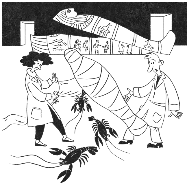
Рис. 2. Онкологические заболевания появились не сегодня и не вчера. Ученые обнаруживают следы раковых опухолей в костях древних животных и мумиях египетских фараонов

на предложенную подачку. Некоторое время рак по аналогии с чумой и проказой считали заразным заболеванием и онкологических больных пытались изолировать от общества, но, к счастью, это заблуждение просуществовало недолго.