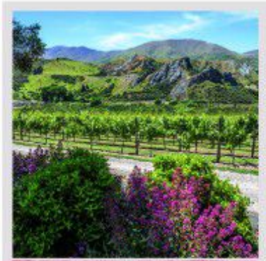
Виноградники поблизу Квінстауна, Нова Зеландія

Ну а тепер саме час повернутися до Нової Зеландії і збагнути, що її становище у вищезгаданій шережі типових країн Нового світу особливе. Її присутність в елітному клубі грандів «несвропейського» виноробства я пояснюю наявністю абсолютно унікального, раніше не відомого у світі стилю білого вина — новозеландського Совіньйон Блан! Легкий, повітряний, із яскравою «дзвінкою» кислотністю й ароматом агрусу та тропічних фруктів, Совіньйон Блан