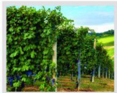
Річковий і безкомпромісний клімат П'ємонту якнайкраще відповідає вирощуванню червоних сортів винограду

У перекладі з італійської означає «солодкий». За популярністю посідає наступне місце за Барберою. Сорт цей ще більш демократичний,