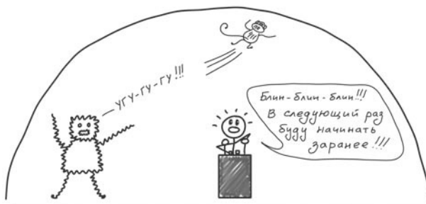
Рис. 5. Собран, сосредоточен, сконцентрирован

Это панический монстр — персонаж, появляющийся в те моменты, когда что-то начинает серьезно угрожать нашей безопасности или карьере. Обезьянка его боится. Она покидает насиженное место и сваливает, оставляя у руля рационального типа.