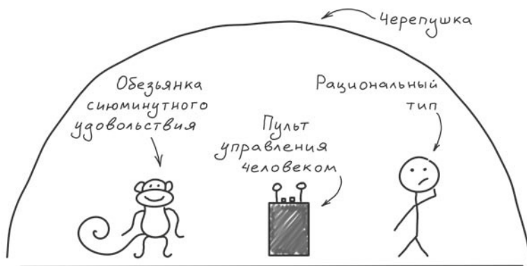
Рис. 3. Модель Тима Урбана

В отличие от рационального типа обезьянка не способна извлекать уроки из прошлого и на основании их как-то корректировать настоящее, чтобы повлиять на будущее. У обезьянки есть только «здесь и сейчас».