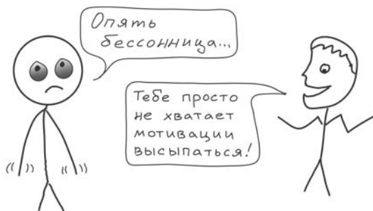
Рис. 2. Не высыпaeшьcя — ты просто недостаточно сильно этого хочeшь...

Неужели это все из-за того, что вы были недостаточно мотивированы, чтобы выспаться перед очередным важным событием?