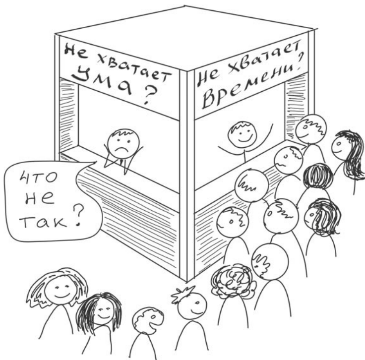
Рис. 7. Нехватка времени и ума

Один из центральных посылов «Джедайских техник» звучит так: очень часто мы не успеваем что-либо сделать не потому, что нам не хватило времени, а потому, что нам не хватило ума. Или того самого мыслетоплива.