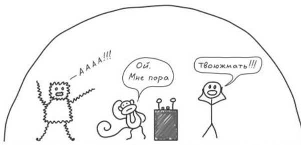
Рис. 4. Панический монстр