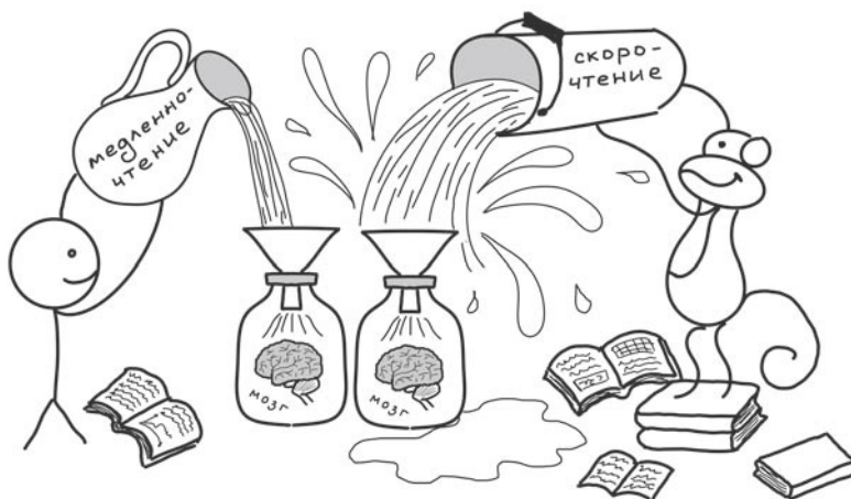
Рис. 1. Медленночтение и скорочтение

Не торопитесь — так будет быстрее. Если ваша цель — изменить свое поведение или взгляды на жизнь, скорость потребления информации вряд ли будет для вас решающим параметром. Знания усваиваются медленно.