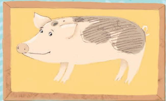
Пьетрен из Бельгии

увлажнённые места и поэтому не живём в пустынях, где нет воды и растений. В 2009 году обнаружен целый свиной остров под названием Сау. Расположен он в районе Багамских островов. Там много пресной воды, мест, где можно спрятаться от тропических штормов, а большую часть жителей этого чудесного острова составляют счастливые свиньи. Говорят, их давным-давно завезли туда моряки. Зачем? Этого я не знаю. Но свиньям остров пришёлся по вкусу. Они целыми днями бездельничают, гуляют по пляжу и купаются в тёплой воде. Вот бы мне попасть туда хоть на часок! Подрасту немного – и сразу на этот остров! Побездельничаю, сколько смогу, и, может быть, вернусь.