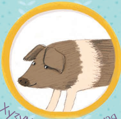
Хузумская протестная из Дании