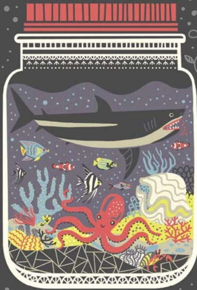
БОЛЬШОЙ БАРЬЕРНЫЙ РИФ