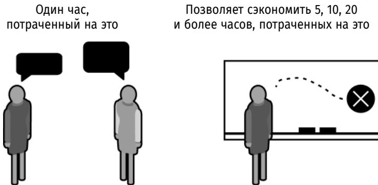
Рис. 1.1. Беседы с потребителями экономят время и деньги

Бережливым развитием потребителей может заниматься любой, кто контактирует с имеющимися потребителями или изучает их. Это может быть основатель стартапа, у которого еще нет ни продуктов, ни клиентов, или работник компании, производящей множество продуктов и имеющей колоссальную клиентуру. Теперь, когда я сформулировала свое понимание термина «бережливое развитие потребителей», я буду называть его просто «развитием потребителей».