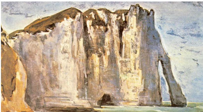
[Рис. б] Эжен Делакруа. Утес в Этрета. 1849. Голубая бумага, уголь, гуашь. 14,5 × 24 см. Музей Бойманса — ван Бёнингена, Роттердам, Нидерланды