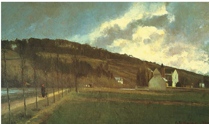
[Рис. а] Камиль Писсарро. Берега Марны зимой . 1866. Холст, масло. 91,8 × 150,2 см. Чикагский институт искусств, США