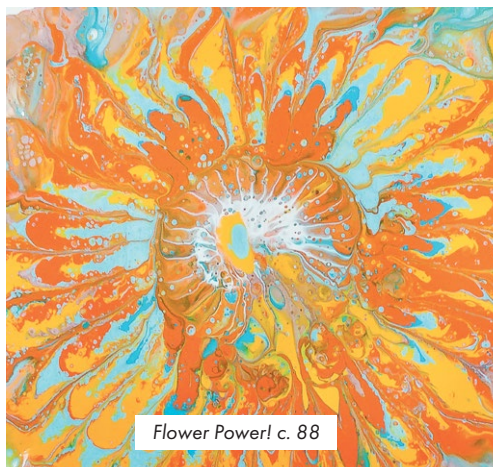
Flower Power! с. 88