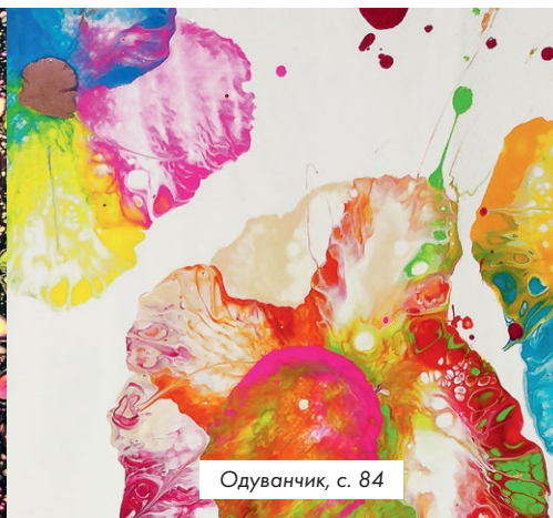
Одуванчик, с. 84