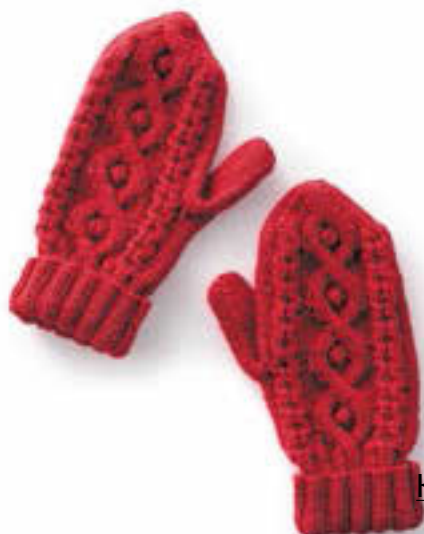
Варежки с косами Инструкции на с. 119