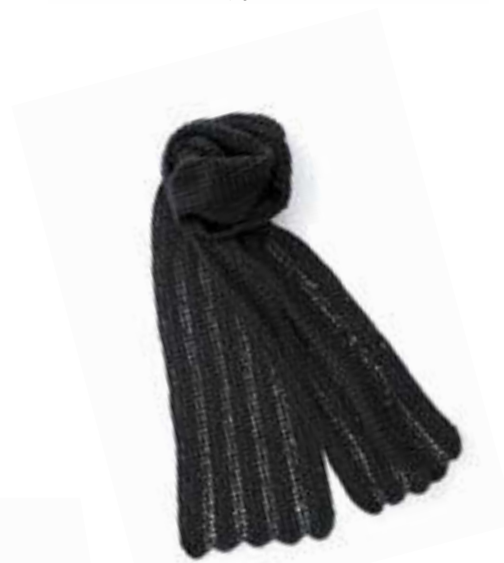
Ажурный шарф Инструкции на с. 118