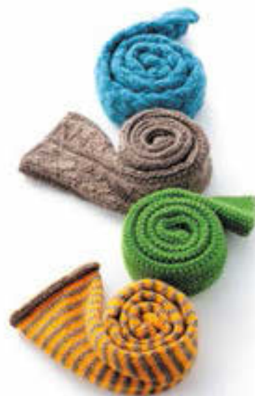
Маленькие шарфики Инструкции на с. 117