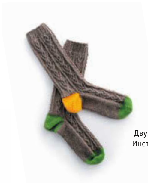
Двухцветные носки Инструкции на с. 120