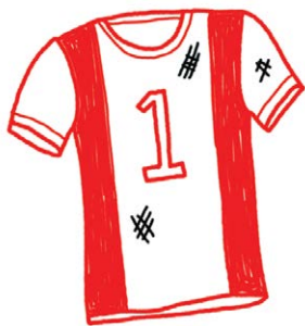
Счастливая футболка, не стирать