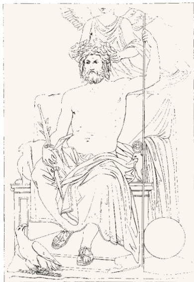
Могучий Зевс с молнией и орлом, в венке победы

По воле, мальчик, Зевса тяжкогромного Конец приходит к смертному. Не сами мы Судьбу решаем нашу. Кратковечные, Как овцы, мы проводим жизнь, не ведая, Какой конец нам бог готовит каждому. Семонид Аморгосский, Доля смертных, 1 (1)