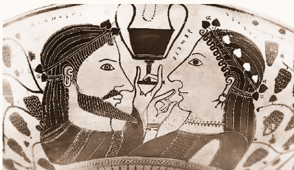
Дионис делит кубок вина со своей матерью Семелой

Жрица Зевса Семела была чарующе прекрасна, так что Зевс немедленно решил ее соблазнить. Естественно, бог явился к ней в облике смертного. Забеременев, Семела спохватилась и стала задаваться вопросом, действительно ли ее галантный и сладкоречивый любовник был человеком. Она потребовала, чтобы Зевс явился к ней в своем истинном облике. Бог, связанный обещанием выполнять требования женщины, неохотно согласился. Увидев его в сиянии истинной славы, Семела немедленно сгорела и превратилась в головешку.