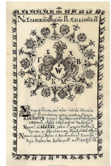
Титульна сторінка «Реєстрів усього Війська Запорозького після Зборівського договору з королем Польським Яном Казимиром, складених 1649 року, жовтня 16 дня» (1875, Москва)

Почесну посаду полковника Миргородського полку В. П. Капніст перебрав від представників відомого козацького роду Апостолів — військового політика, державного діяча, гетьмана Війська Запорозького Данила Апостола та його сина Павла, котрі очолювали полк упродовж 1682–1736 рр. У роки керівництва Миргородським полком Василь Капніст заснував слободу, яку назвав на честь народження другого сина Миколаївкою (нині село Троїцьке Глобинського району Полтавської області). Саме там оселилося подружжя Чайок і народився дід композитора — Петро Федорович Чайка (1745–1818).