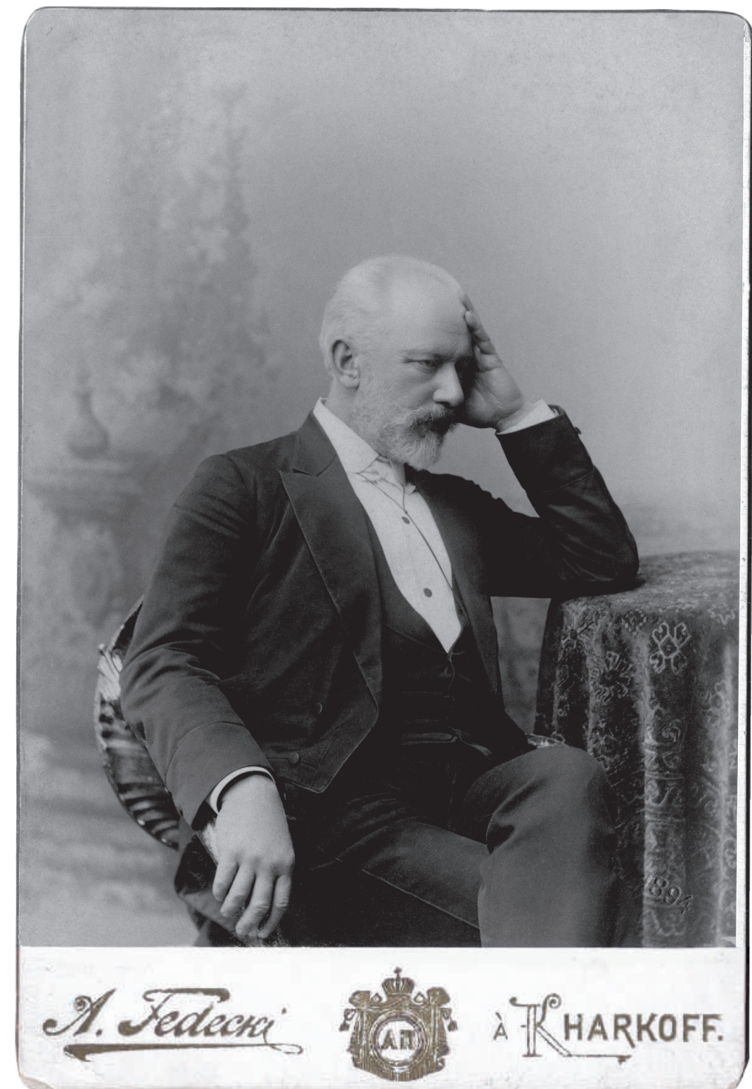
Петро Чайковський. 14 березня 1893. Харків. Фото Альфреда Федецького