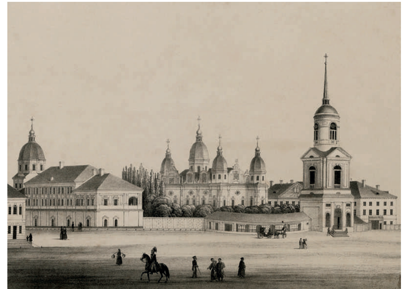
Києво-Братський монастир і Духовна академія в Києві. Вид з площі. Поч. XIX ст. Автор невідомий.

Отже, триступенева музична освіта — школа, училище, консерваторія — склалася у XIX ст. «коли у шістдесятих роках у житті Імперії увійшло Російське музичне товариство» 14 . Однак музична освіта як така на теренах України, звісно, існувала з часів набагато давніших. Зрозуміло, що з прийняттям християнства у Київській Русі почали