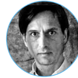
ДЖЕЙК БАДДЕЛІ (JAKE BADDELEY) Сучасний художник і скульптор (Нідерланди)

У підсвідомості людини виникають час від часу дивні «картинки», які не збігаються з реальністю. Та мало хто наважується перекласти ці образи на полотно. Сучасний нідерландський художник Джейк Бадделі, твори якого є «картинками несвідомого», поділився з «КЖ» своїм глибоким відчуттям сюрреалістичного світу уяви.