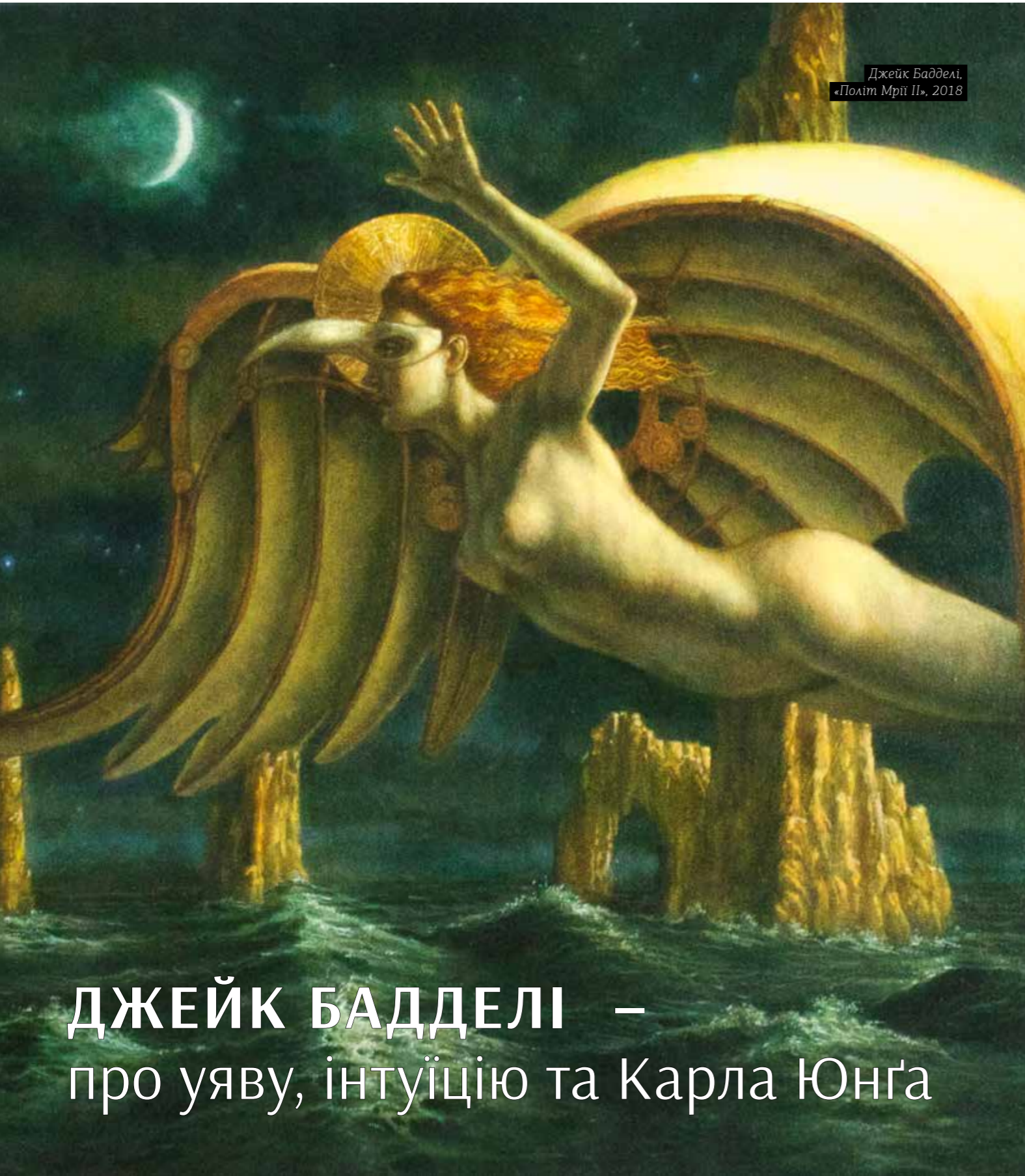
Джейк Бадделі. «Політ Мрії II», 2018