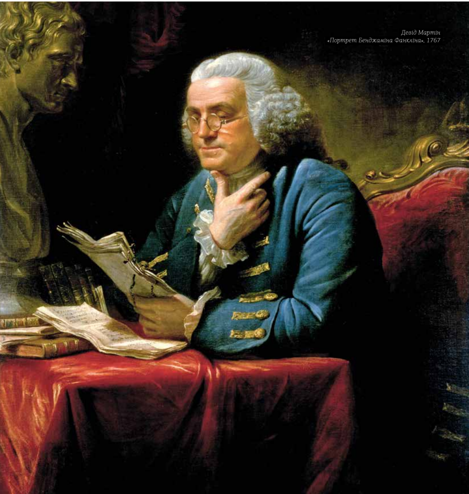
Девід Мартін «Портрет Бенджаміна Франкліна», 1767