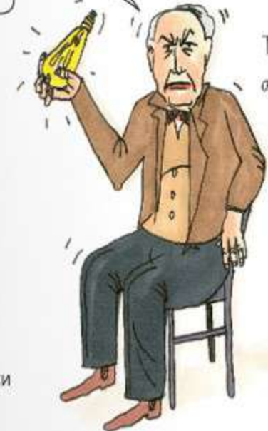
Томас Алва Едісон, американський винахідник

Сто років вони користувалися моїми лампочками, а тепер їх, бач, осінило, що вони використовують забагато енергії!