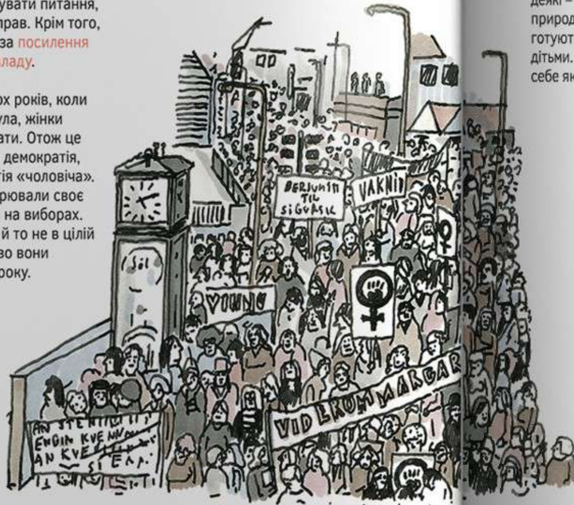
Рейк'явік, 24 жовтня 1975 року