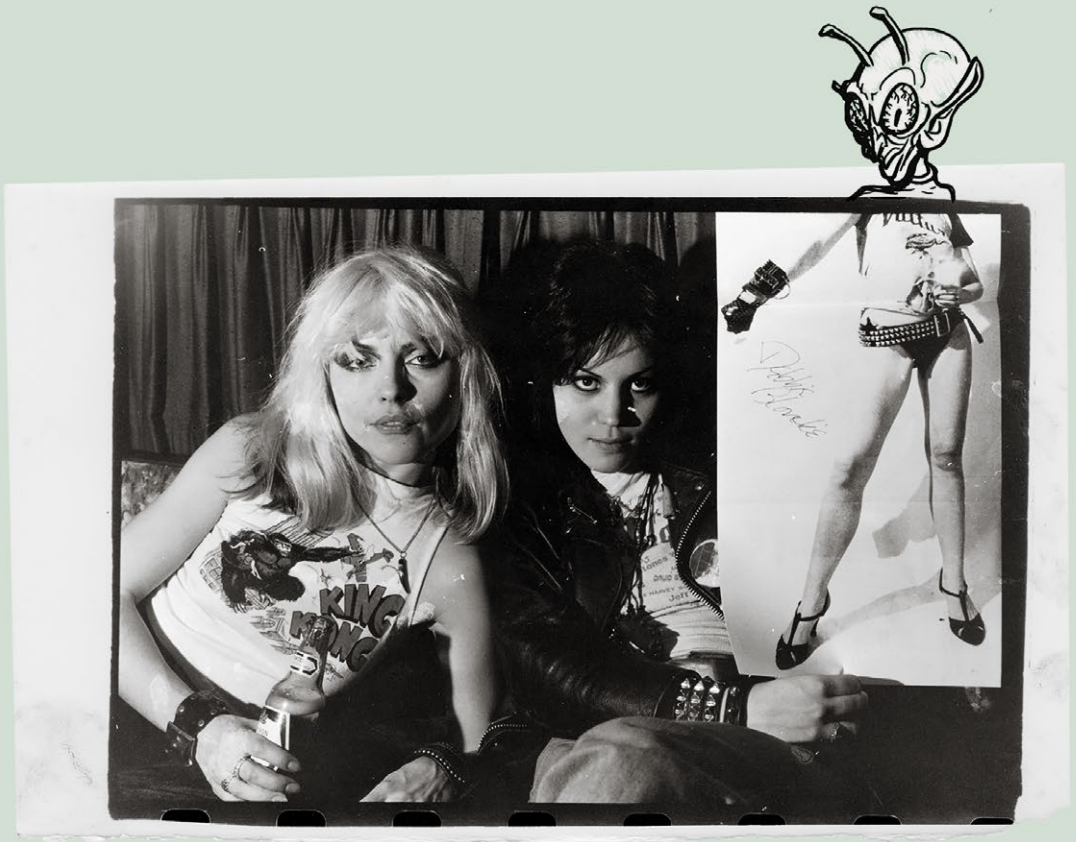
Джоан Джетт и я. Настоящие девушки андеграунда