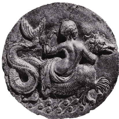
Нереида верхом на ketos (морском чудыще)

Итак, прежде всего необходимо забыть о «сверхъестественном». Однако, чтобы понять, что такое магия древности, нам придется еще много чего выбросить из головы. В нашем мире — особенно на Западе — религия уже давно присвоила исключительное право на взаимодействие с невидимыми силами и субстанциями. В древности такой монополии не существовало. Религиозный институт спонсировался государством, а вера воспринималась как гражданский долг каждого человека; задача религии состояла в том, чтобы поддерживать мир