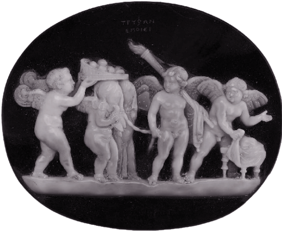
Купидоны на свадьбе. Обратите внимание на фрукты (яблоки или гранаты), на поводок и на то, что один из купидонов держит факел вместо лука

неделя изжоги. Автор снимает с себя ответственность за любые последствия — физические, психологические и моральные.