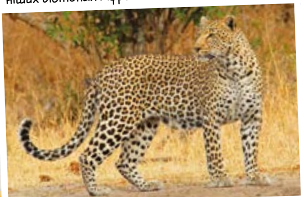
▼ Леопарди зустрічаються у найрізноманітніших біотопах Африки та Азії.