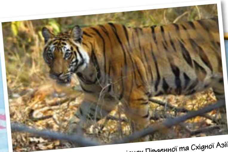
▲ Тигри збереглися в деяких регіонах Південної та Східної Азії. Вони зустрічаються від тропічних лісів до Сибірських лісів.