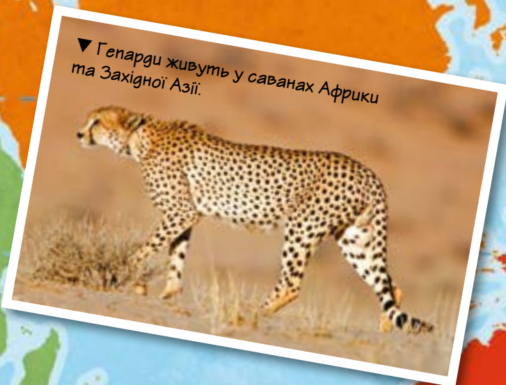
▼ Гепарди живуть у саванах Африки та Західної Азії.