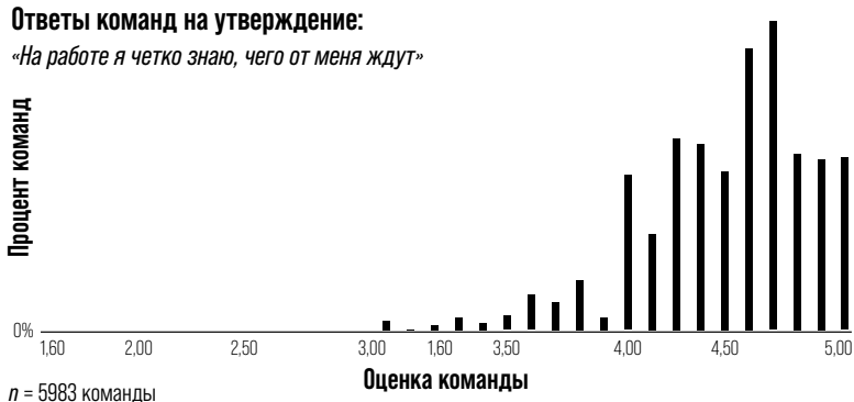
Рис 1.1. Ясность ожиданий

«На работе я четко знаю, чего от меня ждут»