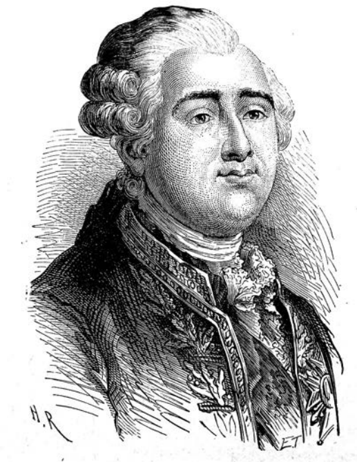
Людовик XVI. Гравюра Э. Тома с портрета работы А. Руссо

XVIII столетия самыми разными странами, переживающими в наши дни радикальные перемены, не хватит и книги.