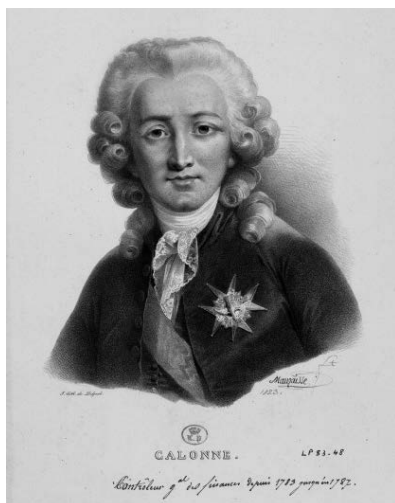
Шарль-Александр де Калонн. Эстамп с портрета кисти Э. Вижье-Лебрён

мало-мальски конфликтными ситуациями, опасался резких действий после того, как в 1774–1776 годах финансовые реформы его министра Тюрго вызвали активное сопротивление аристократии с Парижским парламентом во главе. Однако зияющая дыра в бюджете вынуждала Калонна идти на решительные шаги, даже рискуя навлечь на себя ненависть привилегированных сословий.