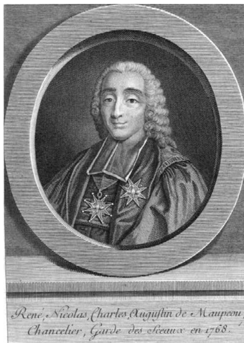
Рене Николя де Мопу. Гравюра XVIII в.

препона с их пути устранена, но... 10 мая 1774 года Людовик XV скоропостижно скончался от оспы.