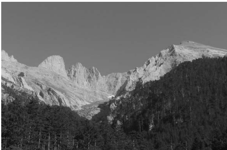
Илл. 1.2. Вид через ущелье на гору Олимп (2917 м). Греки верили, что на ее вершине обитают боги. Горный рельеф занимает большую часть территории Греции

(илл. 1.2). Поверхность большинства греческих островов тоже гористая и скалистая. Лишь 20–30 процентов суши пригодно для земледелия, однако некоторые острова, западное побережье Малой Азии, Великая Греция и некоторые участки территории Балканской Греции, в особенности Фессалия на северо-востоке и Мессения на юго-западе, где есть достаточно обширные равнины, позволяли обеспечить щедрый урожай и корм для крупного рогатого скота. Недостаток равнинных земель во многих районах не позволял содержать сколько-нибудь значительное число коров и лошадей. Самыми распространенными животными, которых на территории Греции одомашнили еще в конце каменного века, стали свиньи, овцы и козы. К VII в. до н. э. в Грецию с Ближнего Востока завезли домашних кур.