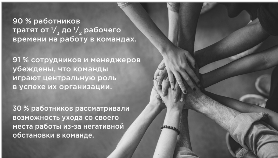
Данные о современных командах

В исследовании директоров, относящихся к широкому спектру отраслей экономики, проведенном CCL, 91 процент опрошенных считают, что команды играют центральную роль в успехе их организации. А 95 процентов утверждают, что служащим приходится одновременно участвовать в работе сразу нескольких команд. Эта новая норма означает, что команды являются не просто самодостаточными единицами. По сути, это сетевые структуры, сотрудничество которых выходит за рамки организации и даже за географические границы.