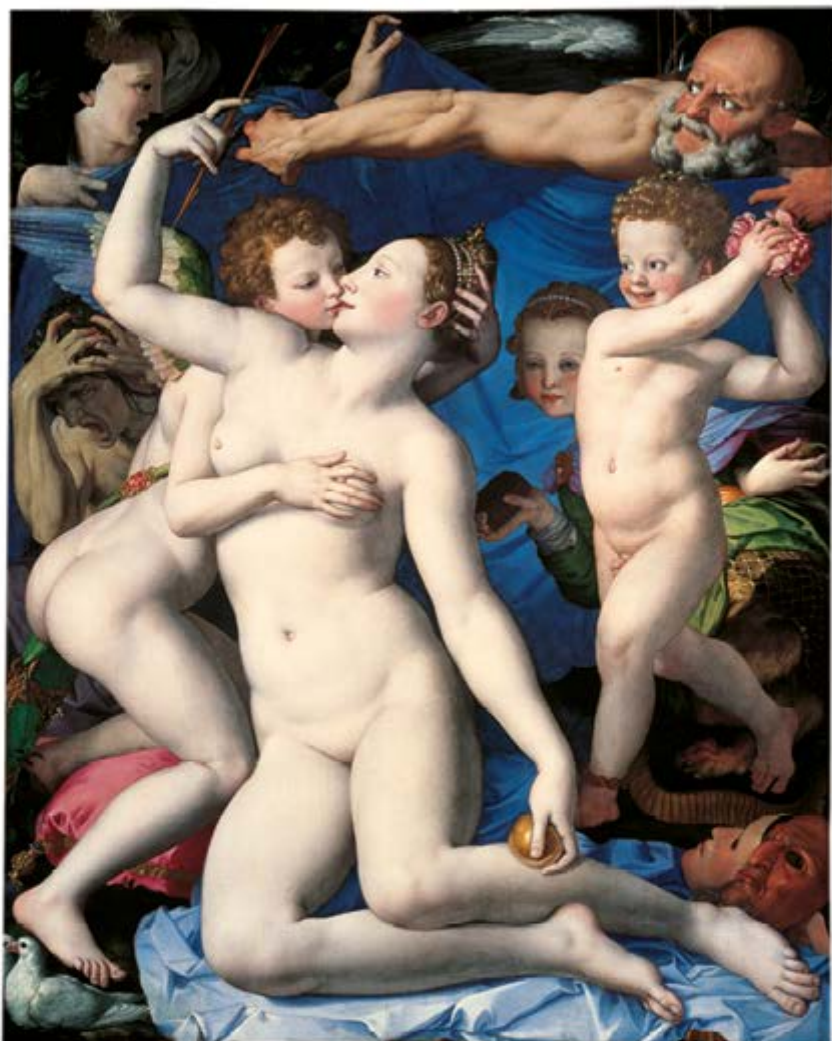
Аньоло Бронзіно «Венера, Амур і алегорія Ревнощів» Приблизно 1545 р. Полотно, олія, 146 x 116 см Національна галерея, Лондон

Цю складну алегоричну картину було створено і для повчання, і для розпалювання уяви культурної еліти.