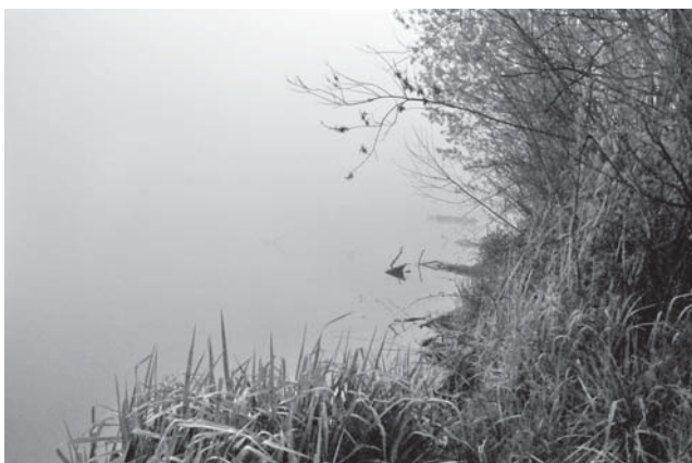
Висла на рассвете

Они ковыляли на онемевших ногах, вдруг послышался вой лагерьной сирены и рев мотоциклов вдалеке. Ощувив всплеск адреналина, Ян помчался в сторону леса, а Витольд с Эдеком едва поспевали за ним. До леса Ян добрался первым 31 .