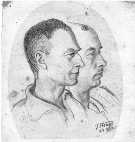
Витольд и Томаш. Рисунок Яна Стащиневича. Июль 1943 года.

оденут форму СС, чтобы без проблем доехать до лагеря, а затем прорваться обратно. Витольд понимал, что это крайне рискованная операция, но чувствовал, что он в долгу перед теми, кто остался в лагере 64 .