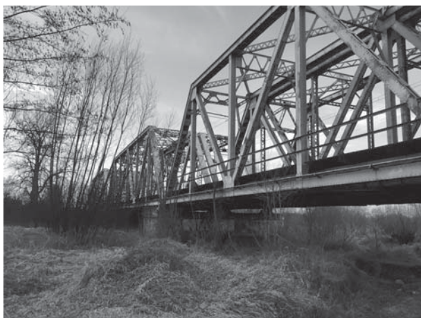
Мост через реку Солу

— Ты говорил, что знаешь, куда идти? — спросил Ян, наклонившись и тяжело дыша, когда Витольд и Эдек, наконец, догнали его 24 .