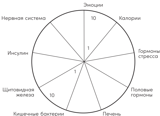
Рис. 1. Ваша диаграмма Случайного лишнего веса