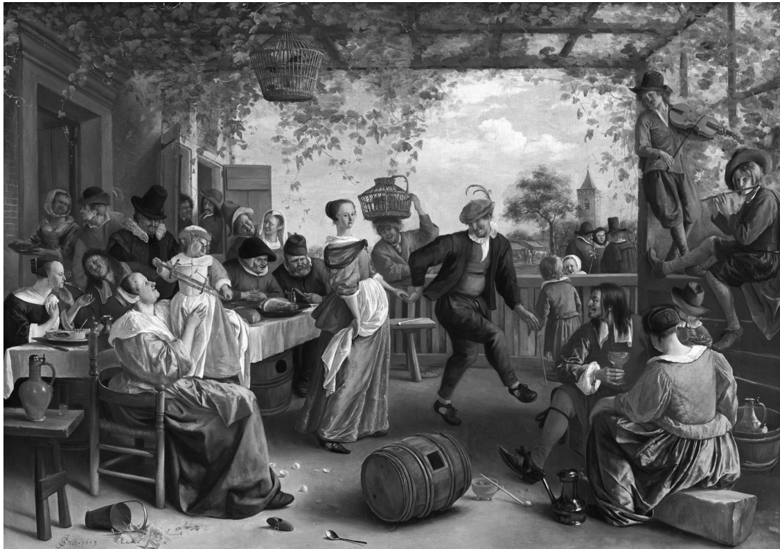
Картина Яна Стена «Пара, що танцює», 1663 р. У Нідерландах гумористичний вислів «господарство Яна Стена» означає дім, у якому панує безлад, проте весело