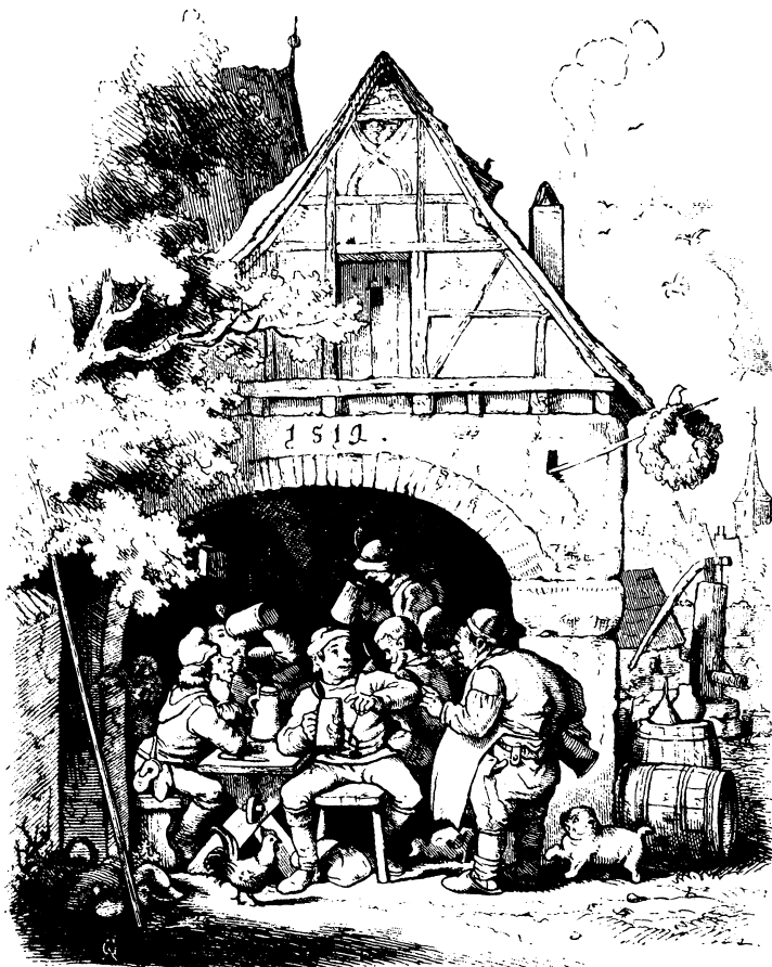
Весела компанія в шинку. Ксилографія Людвіга Ріхтера, XIX ст.

Чи потреба сп'яніти є реакцією людини на те, що вона усвідомила себе і свою смертність? Ми не тварини, не боги і достеменно не знаємо, як би прожили своє життя. Чи сп'яніння – місце спочинку під час пошуків сенсу нашого існування? Чи це спосіб викинути з голови гнітючі роздуми про насущні життєві питання?