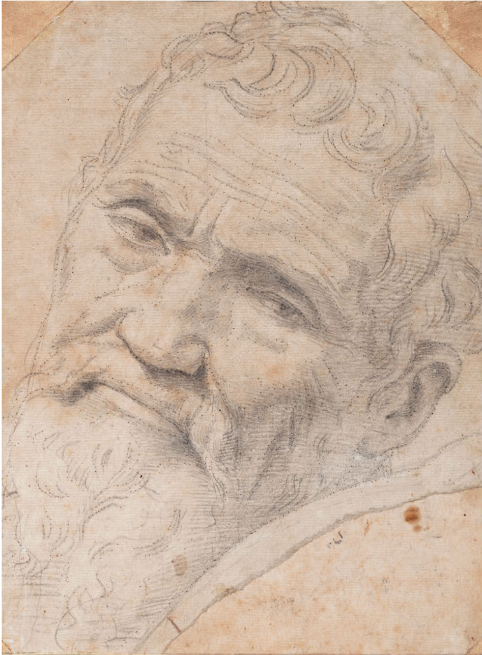
Даниэле да Вольтерра. Портрет Микеланджело. 1551–1552