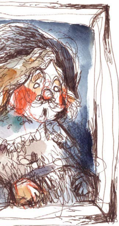
FRANZ HALS PORTRAIT OF A MAN 1636