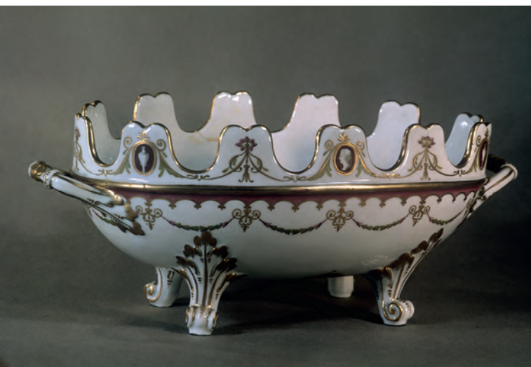
Рюмочная передача производства Императорского фарфорового завода (Петербург, 1780-е гг.)

За прошедшие столетия изменились некоторые обычаи в подаче вина. Так, раньше обходились одним бокалом для всех типов вин. Рядом со столами для гостей размещался специальный стол для омовения бокалов: посуду мыли в серебряных чашах с водой и розовыми лепестками на протяжении всей трапезы. В начале XVIII столетия в Шампани розовые лепестки заменили льдом, чтобы охлаждать бокалы при их омовении, а не ароматизировать. В это же время в Англии и еще нескольких европейских государствах ввели налог на стеклянные бокалы больших размеров, который взимался вплоть до середины XIX века. В результате низшие сословия перешли на маленькие стеклянные рюмки, а монархи и богатые аристократы заказывали себе бокалы «напоказ» размером с голову младенца и с удовольствием позировали с ними для парадных портретов.