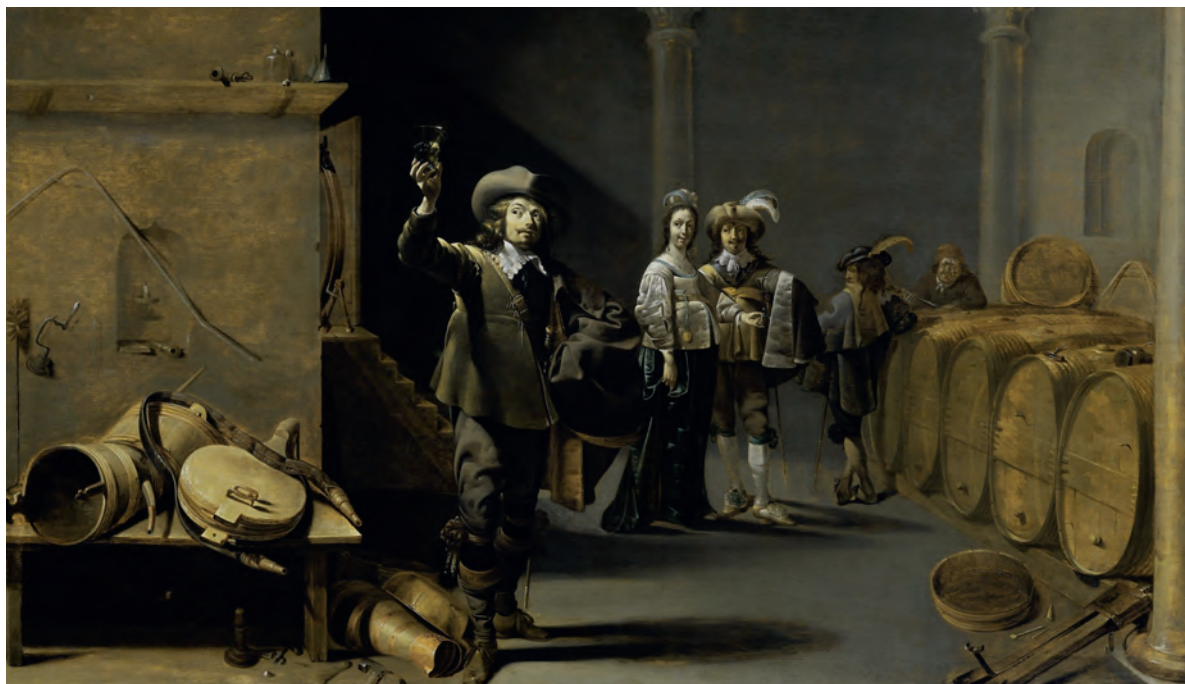
Знатоки вина, Якоб Дак, 1640–1642, голландская живопись

путешествия или военного похода. И только в XVII веке сомелье приблизился к королевскому двору и превратился в доверенное лицо, которое выбирает и приготавливает напитки. Подающий вино также должен был пробовать все напитки перед подачей на стол, чтобы убедиться, что они не отравлены. Если у феодала не было эшансона, то эту обязанность возлагали на того слугу, который принес вино к столу.