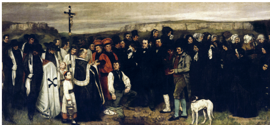
Гюстав Курбе. Похороны в Орнанах. 1849 — 1850 гг. Музей д'Орсэ, Париж

роны жизни: бедность, печальную старость, пьянство — то есть многое, что не вызывает эстетического восторга. Одной из самых показательных картин стала работа «Похороны в Орнанах» Гюстава Курбе. Это картина огромно-