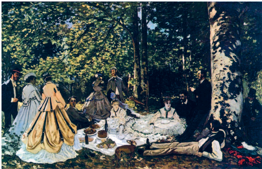
Клод Моне. Завтрак на траве. 1866 г. ГМИИ им. А.С. Пушкина, Москва

руку к тарелке, при этом внимательно смотрит на отдыхающего под деревом господина. Дамы слева ведут разговор между собой, а стоящая ближе всего к переднему краю картины собачка внезапно обернулась на них.