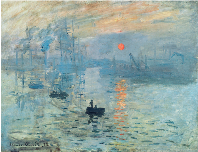
Клод Моне. Впечатление. Восходящее солнце. 1872 г. Музей Мармоттан-Моне, Париж

Французский зритель на ежегодных выставках, которые устраивала Академия художеств — главный орган в сфере искусства, определявший то, как должен работать живописец, — видел в основном картины современных ему мастеров.