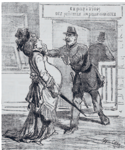
Карикатура на выставку импрессионистов. Французская иллюстрированная газета Le Charivari, 1874 г. Национальная библиотека Франции, Париж

и повышало ценность полотна. Проще говоря, чем дороже были предметы, показанные на картине, тем дороже становилась и сама картина. Данное обстоятельство подталкивало художников к созданию всё новых и новых полотен, изобилующих изысканными материалами.