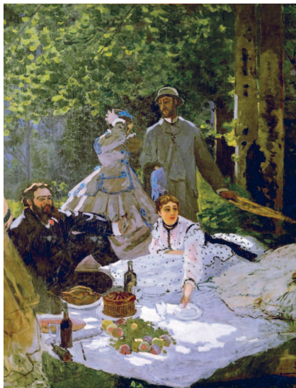
Клод Моне. Завтрак на траве. Фрагмент несохранившейся картины. 1866 г. Музей д'Орсе, Париж

Невзирая на правильность композиции, художник передал мгновение общения людей, непринуждённого и лёгкого. Ощущению лёгкости вторят пятна света и солнечные блики, скачущие по поверхностям. Свет проникает на лужайку сквозь ветви деревьев, часть листьев находится в тени, а часть — на солнце. Художник показал это разными оттенками зелёного, изобразив быстрые переходы от светлого к тёмному, — это даёт ощущение быстрого движения, трепета листьев. Пробиваясь сквозь ветви, свет оказывается на скатерти, и световые пятна всё время перемещаются, двигаясь вслед за движением деревьев.