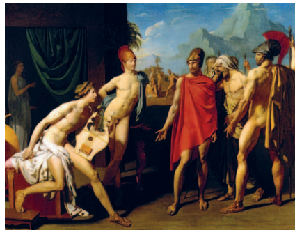
Жан Огюст Доминик Энгр. Послы Агамемнона у Ахилла. 1801 г. Национальная высшая школа изящных искусств, Париж

Самым известным представителем академизма этого времени был Жан Огюст