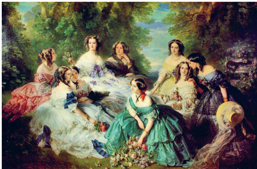
Франц Ксавер Винтерхальтер. Императрица Евгения и её дамы. 1855 г. Шато-де-Компьень, Компьень

Чтобы понять новый взгляд Мане, сравним его картину с работой мастера парадных портретов Франца Винтерхальтера. В 1855 году он также написал отдыхающих в тени деревьев француженок. На полотне «Императрица Евгения и её дамы» изображена супруга Наполеона III в окружении фрейлин. Художник показал её сидящей чуть выше остальных, в белом платье с фиолетовыми бантами, и выделил более интенсивным светом. Композиция картины абсолютно уравновешенная: левая часть соответствует правой, дамы показаны сидящими в кругу. В таком случае фон в виде деревьев кажется чем-то вроде декорации. Все дамы на картине — реаль-