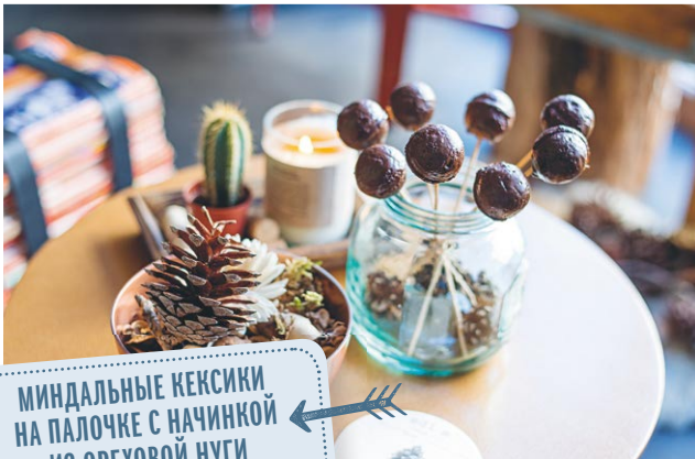
МИНДАЛЬНЫЕ КЕКСИКИ НА ПАЛОЧКЕ С НАЧИНКОЙ ИЗ ОРЕХОВОЙ ЛУГИ РЕЦЕПТ НА С. 189

СОВЕТУЮ КАЖДОЙ, КТО РАЗВЛЕКАЕТСЯ МЫСЛЮ ОТКРЫТЬ СОБСТВЕННЫЙ МАГАЗИН, — ИСПОЛНИ ЭТУ МЕЧТУ! НИКТО НЕ СДЕЛАЕТ ЭТО ЗА ТЕБЯ. НИ ОДНО РАБОЧЕЕ МЕСТО, НИ ОДИН ПАРТНЕР, НИ ОДНА ФИРМА НЕ СТОЯТ ТОГО, ЧТОБЫ ОТРЕЧЬСЯ ОТ СЕБЯ И ИСПОЛНЕНИЯ СВОЕГО ЗАВЕТНОГО ЖЕЛАНИЯ.