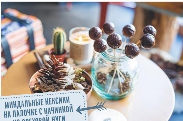
МИНДАЛЬНЫЕ КЕКСИКИ НА ПАЛОЧКЕ С НАЧИНКОЙ ИЗ ОРЕХОВОЙ ЛУГИ РЕЦЕПТ НА С. 189

СОВЕТУЮ КАЖДОЙ, КТО РАЗВЛЕКАЕТСЯ МЫСЛЮ ОТКРЫТЬ СОБСТВЕННЫЙ МАГАЗИН, — ИСПОЛНИ ЭТУ МЕЧТУ! НИКТО НЕ СДЕЛАЕТ ЭТО ЗА ТЕБЯ. НИ ОДНО РАБОЧЕЕ МЕСТО, НИ ОДИН ПАРТНЕР, НИ ОДНА ФИРМА НЕ СТОЯТ ТОГО, ЧТОБЫ ОТРЕЧЬСЯ ОТ СЕБЯ И ИСПОЛНЕНИЯ СВОЕГО ЗАВЕТНОГО ЖЕЛАНИЯ.