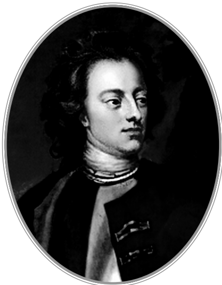
Король Швеции Карл XII. Худ. М. Дахл