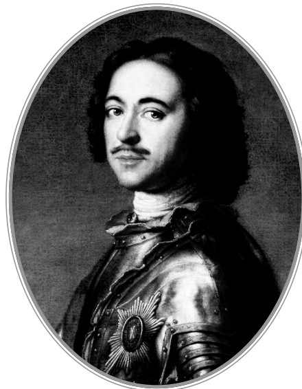
Российский император Петр I. Худ. Ж.-М. Натье