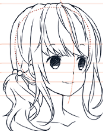
РАКУРС 3/4, ПРАВОРУЧ

У ракурсі 3/4 віддалений бік обличчя «сплющується», а отже, віддалене око має бути вужчим.