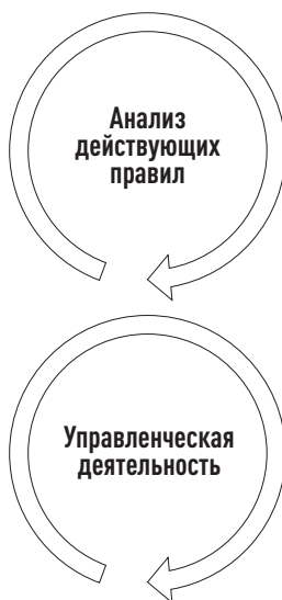
Рис. 3. Обучение обучению

Развивайте вашу систему управления! Обеспечьте возможности для внесения позитивных изменений в практику управления вашей организации. Ищите новые подходы и технологии. Не останавливайтесь на достигнутом. Создавайте новые критерии принятия решений. Следите за тем, чтобы вариативность вашей системы управления была выше, чем у конкурентов.