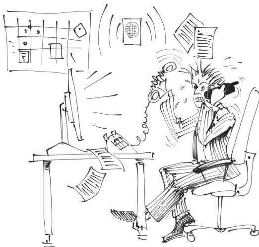
Рис. 5. В потоке информации

Так, компания, являвшаяся абсолютным лидером в своей отрасли, перешла на полностью ручное управление розничными продажами. Генеральный директор компании, имеющей более сотни торговых точек, лично принимал по телефону отчеты от каждого магазина о продажах за неделю, определяя по результатам работы процент премиальных или лишая сотрудников бонусных выплат. В своей работе руководитель следовал принципу: «Лучшее доверие — это личный контроль». В результате, он стал заложником собственного стиля управления. Малейшее ослабление контроля сразу приводило к снижению дисциплины и отрицательно сказывалось на результатах продаж.