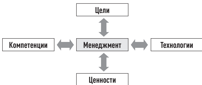
Рис. 1. Роль менеджмента в современной организации

дача, заключающаяся в постоянной боеготовности спецподразделения, будет решена.