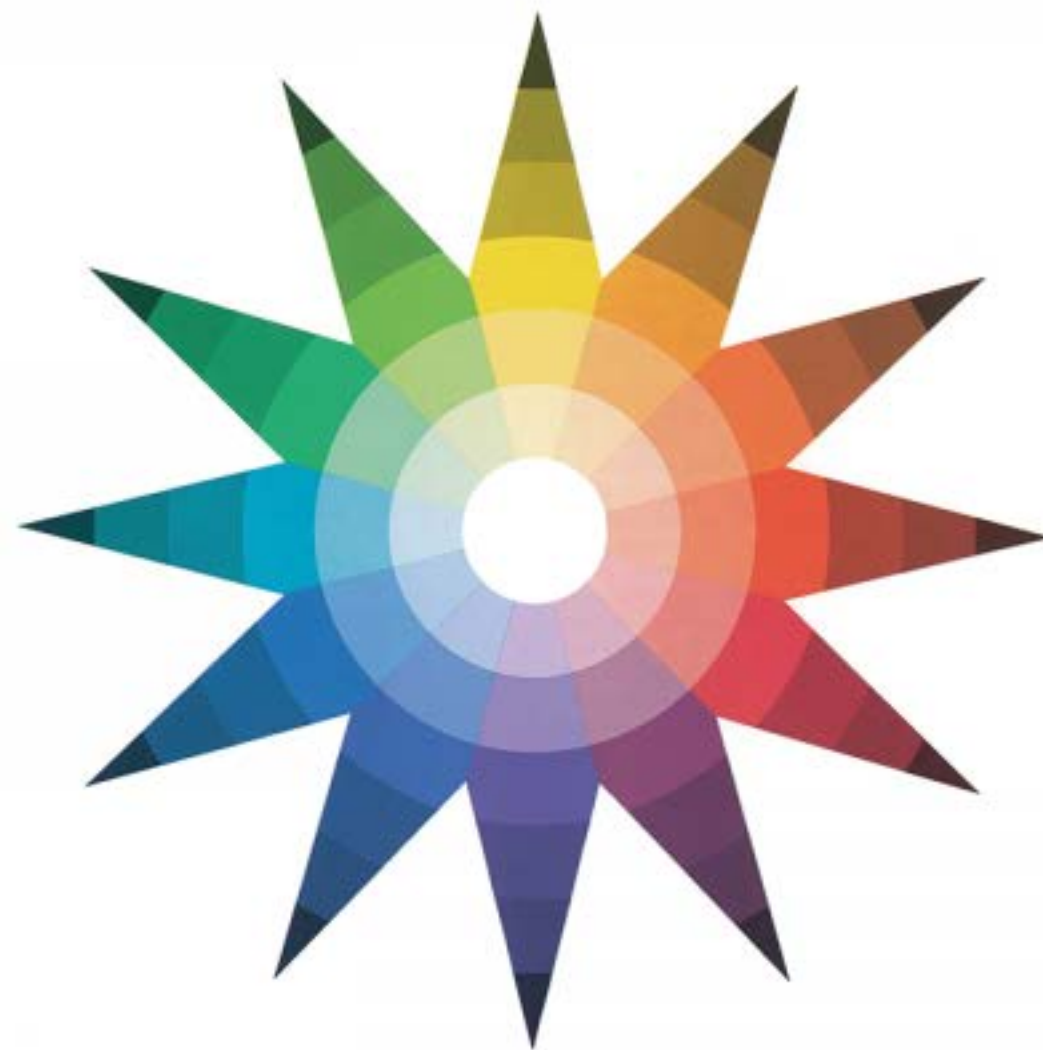
Рис. 48 Дванадцятикутна зірка кольорів

Після огляду потенційних кольорових ефектів у семи контрастах я спробую укласти ясну й повну мапу світу кольорів. На рис. 3 — коло кольорів із 12 відтінками трьох основних кольорів: жовтого, червоного, синього. Однак це плоске коло не годиться для всеохопної класифікації. Замість нього нам знадобиться сфера — фігура, яку Філіп Отто Рунґ визначив як найручнішу для передавання всіх особливих і різноманітних властивостей кольорового всесвіту. Сфера — елементарна форма універсальної симетрії. Вона служить для візуалізації правила комплементарності, показує всі фундаментальні зв'язки між кольорами, зокрема між хроматичними кольорами та чорним і білим. Якщо уявити сферу кольорів як прозоре тіло, кожна точка всередині якого відповідає певному значенню, то всі можливі кольори матимуть тут місце. Кожну точку на сфері можна позначити за її меридіаном і паралеллю. Для адекватної класифікації кольорів нам знадобиться лише 6 паралелей і 12 меридіанів. На поверхні кулі окреслюємо шість рівновіддалених паралельних кіл, що утворюють сім зон. Перпендикулярно до цих кіл, від полюса до полюса, проводимо 12 меридіанів. У 12 однакових чотирикутниках, які утворюються