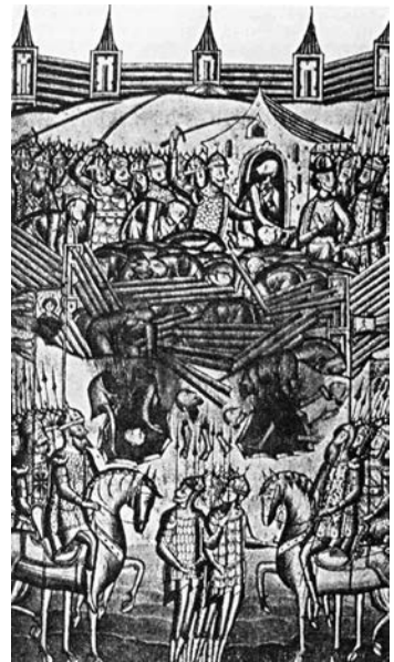
Захоплення Києва монголами. Мініатюра з «Літопису руського»

Мало хто з оборонців та мешканців Києва лишився живим після падіння церкви. Хан Батий рушив зі своїми воїнами далі на захід, захоплюючи решту руських земель, та вдерся на території Польщі та Угорщини. Частково успіх монголів пояснювався тим, що руські землі, які колись централізовано управлялися з Києва, не становили більше якогось єдиного державного утворення, а керувалися князями, які змагалися один з одним за владу і вплив. На початку монгольської навали більшість князів північно-східних земель Русі, які правили на теренах сучасної Центральної Росії, визнавали сюзеренітет князя Володимирського. Південно-західні землі Русі, включно з Києвом, управлялися князями Галицько-Волинськими, а Новгородська республіка на північному сході колишньої Русі вела цілком незалежну від інших руських князівств політику. Але в будь-якому випадку монгольська навала посилювала стан роздробленості Русі. Панування монголів на територіях сучасної України та Білорусі було переважно непрямим, опосередкованим та тривало лише декілька десятиліть. Ці землі в результаті опинилися під контролем Великого князівства Литовського та Королівства Польського. Натомість в північних та