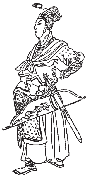
Бату-хан (Батий). Малюнок з китайської мініатюри XIV ст.

східних землях ситуація була іншою. Монголи встановили суворий контроль над Північно-Східною Руссю, чії землі з часом стали переважно територією Росії.