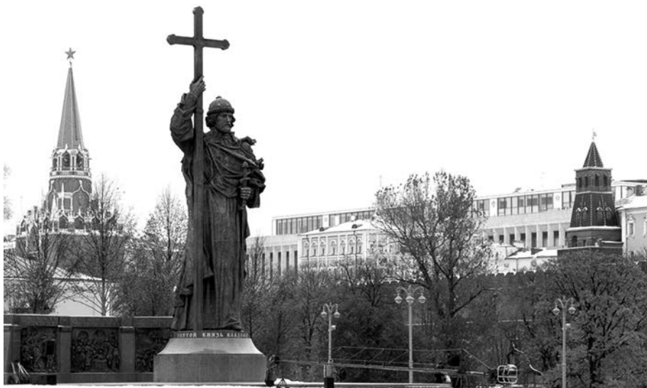
Пам'ятник князю Володимиру на Боровицькій площі в Москві

Монумент відкрив особисто Володимир Путін 4 листопада 2016 року — на День національної єдності, державного свята Росії. Президент Росії виступив з промовою в присутності голови російського уряду — Дмитра Медведєва, Патріарха Російської православної церкви Кирила та вдови знаменитого російського письменника Олександра Солженіцина. Володимир Путін високо оцінив здобутки князя Володимира як «збирача та захисника російських земель і далекоглядного державного діяча, який заклав основу сильної, єдиної, централізованої держави, що стала великою об'єднаною сім'єю рівних народів, мов, культур та релігій». Путін зазначив, що християнство, яке обрав Володимир, «стало єдиним джерелом духовної сили народів Росії, Білорусі та України, заклавши основи моралі та цінностей, якими ми керуємося до сьогодні».