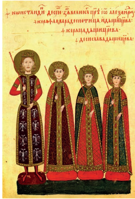
Іл. 10—11: Цісар Іван Александр і деспот Константин Деянович з родинами, мініатюри з Четвороевангелія 1355—1356 р. 54

Невипадково, що саме хрест із певними відмінами було прийнято за герб латинськими імператорами Константинополя. На кінній печатці, яку вживали імператори Генрих I Фландрський (1206—1226) 55 та Роберт де Куртене (1221—1228), зображено щит, усіяний хрестами в колах 56 .