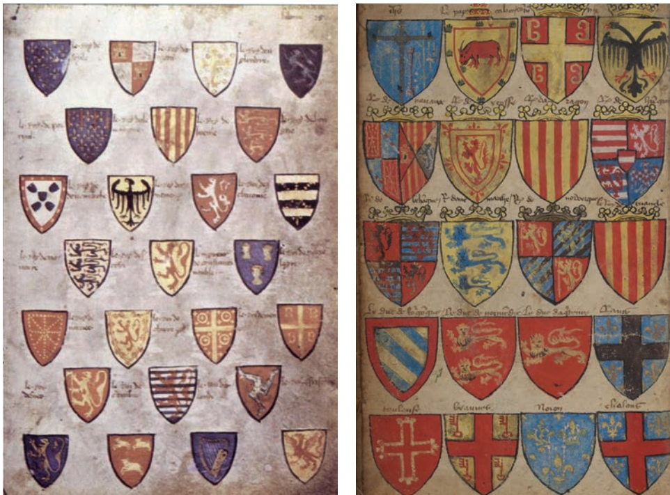
Іл. 1—2: Візантійський герб на сторінках «Armorial Wijnbergen» та «Armorial Le Breton» XIII ст.

Автори деяких досліджень обережно визнають можливість існування гербів у пізньовізантійський період 22 . При цьому відповіді на питання — які саме з імперських знаків визнавати гербами, а яким у цьому праві відмовити — можуть дещо різнитися. Приміром, Александр Соловйов уважав, що «двоголовий орел, як імператорська емблема, як інсигнія деспотів, ніколи не був стійким гербом Візантії», натомість державно-династичним гербом Палеологів визнавав тетравасиліон 23 . Водночас наполягав, що в епоху Комнінів, тобто в XI—XII ст., — «Візантія ще не знала гербів» 24 . Ціла низка дослідників заперечували не лише геральдичний характер ромейського двоголового орла 25 , але й уживання його як імператорського знаку 26 .