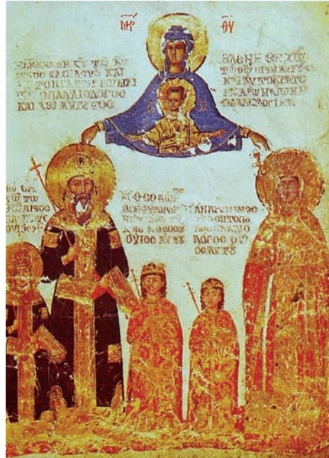
Іл. 9: Імператор Мануїл II Палеолог з родиною, мініатюра із «Творів Діонісія Ареопігита» 1403—1404 рр. 44