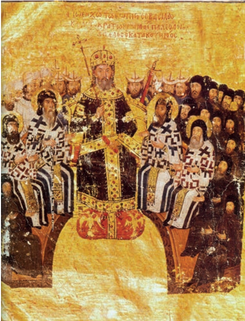
Іл. 8: Імператор Йоан VI Кантакузин на синоді, мініатюра з «Теологічних трактатів» 1370—1375 рр. 43

Уживані на різноманітних носіях, фігури орлів призначалися передусім для розміщення на відповідних інсигніях — стягах, одязі, взутті, суппедіонах тощо⁴⁰. Так, уже Анна Комніна у своїй «Алексіаді» нотує ситуації, коли пурпурове взуття найвиразніше символізує імператорську владу, надівання якого за своїм значенням дорівнювало коронації⁴¹. Надалі пурпурове взуття з зображенням двоголових орлів уживали виключно візантійські василевси⁴², у той час, як особи з іншими вищими титулами, використовували взуття й інші інсигнії влади з відмінним забарвленням.