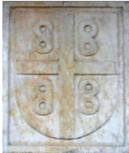
Іл. 6: Візантійський герб на Галатських воротах у Константинополі XIVст.

На печатці 1391 р. Феодора I Палеолога деспота Мореї (1383—1407), сина імператора Йоана V Палеолога, було зображено повний герб, що складався зі щита, шолома й нашоломника з двоголовим орлом 33 .