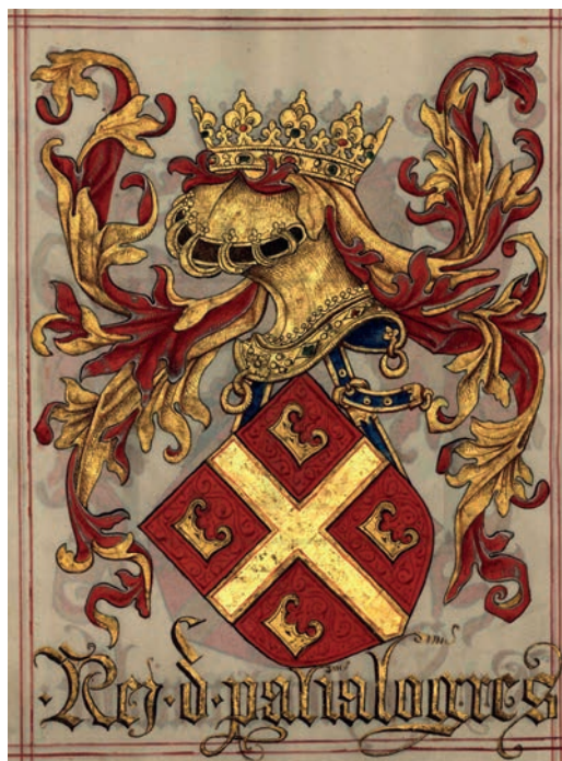
Іл. 3—4: Візантійський герб у «Codex Bergshammар» XV ст. та «Livro do Armeiro-Mor» початку XVI ст.