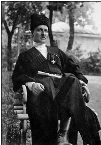
Гетьман Української Держави П. Скоропадський (1873—1945 рр.). Суспільне надбання

Перша. «Основа державного суверенітету у П. Скоропадського — територія, тому його розуміння суверенітету можна визначити як територіальний суверенітет... Ідея державного суверенітету у П. Скоропадського логічно поєднана з ідеєю соборності України».