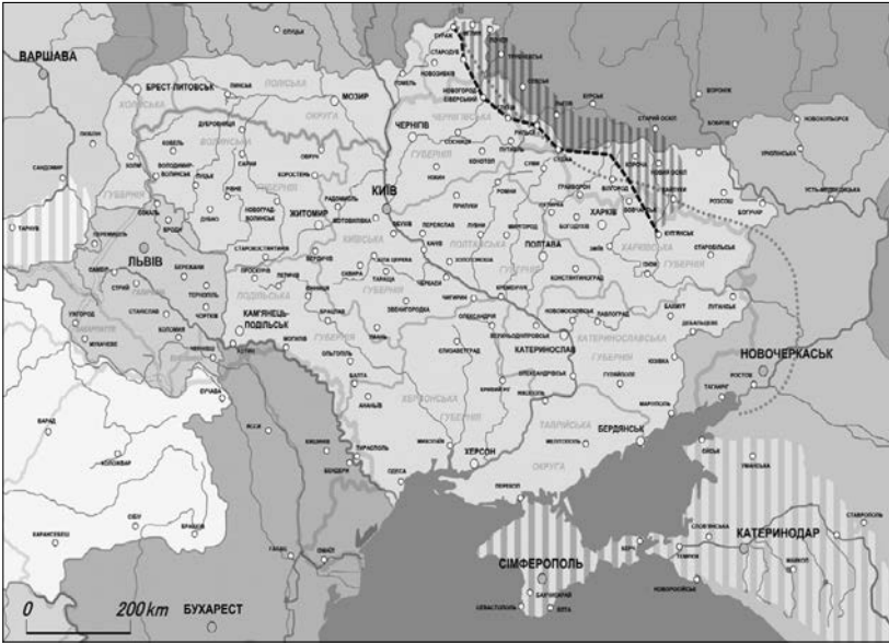
Українська держава в травні—листопаді 1918 р. Суспільне надбання

І це — попри майже столітні вперті зусилля публіцистів та істориків націонал-соціалістичної і комуністичної орієнтації сфальсифікувати добре і давно відомі факти та обставини.