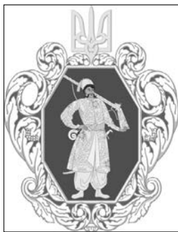
Герб Української Держави. Суспільне надбання

Між тим, знаходимо і виверені, адекватні, науково обґрунтовані оцінки. Наприклад, такі.